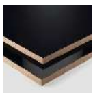
Productos lacados PerfectSense

Los siguientes consejos de limpieza no sirven por igual para todas las superficies EGGER. Para ayudarle, identificamos los productos a los que se refieren las instrucciones con las imágenes siguientes: