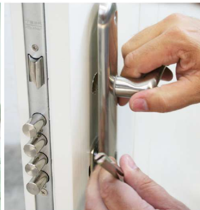
PUERTAS DE EXTERIOR