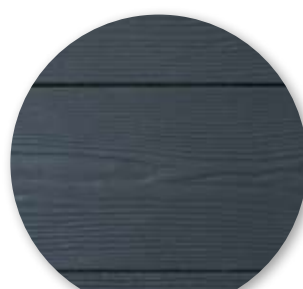
Castaño Oscuro S04