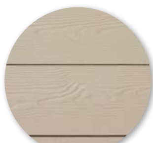
Beige RIF - S11