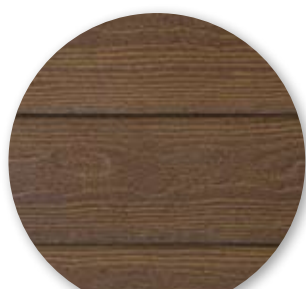
Nogal SL 100